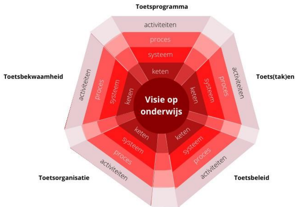
Figuur 1. Toetsweb

In het SKE-traject richten deelnemers zich op de kwaliteit van alle entiteiten waarbij het van belang is dat de deelnemers inzichtelijk kunnen maken hoe de entiteiten van het toetsweb samenhangen en wat de impact is van veranderingen op de verschillende onderdelen van het toetsweb.