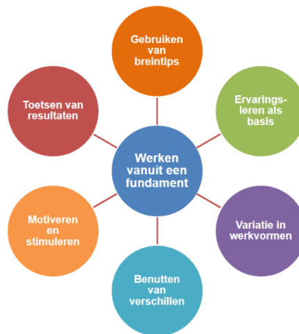
Figuur 1: De pijlers van de didactische visie van activerend opleiden.