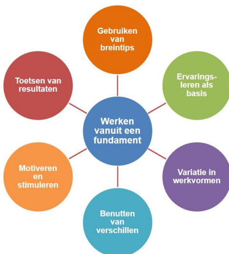
Figuur 1: De pijlers van de didactische visie van activerend opleiden.

De opleiding is gebaseerd op de visie van 'Activerend opleiden'. Deze visie op leren en opleiden berust op zeven pijlers.