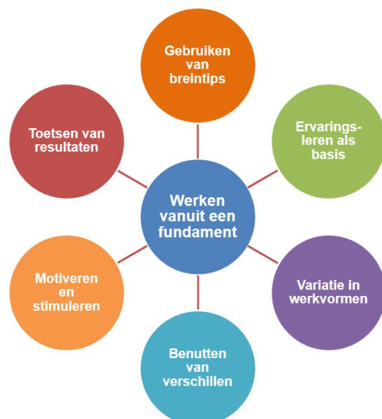
Figuur 1: De pijlers van de didactische visie van activerend opleiden