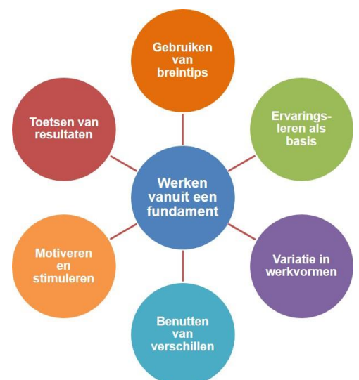
Figuur 1: De pijlers van de didactische visie van activerend opleiden.